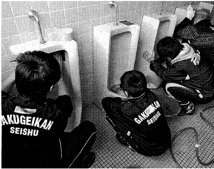
トイレ清掃をする生徒ら。ピカピカに磨きあげていた＝岡山市東区

トイレを磨くことで心も磨く「掃除に学ぶ会」が、岡山市東区の岡山学芸館高・清秀中で開かれた。同校で10年来続けられている取り組みで、トイレ清掃を通じて感謝、感動の気持ちを育む活動。便器をピカピカに仕上げた中学生らは達成感を共有していた。